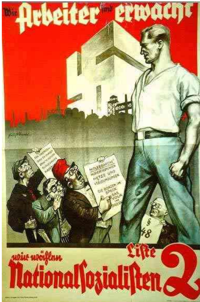
El obrero Alemán Nacional Socialista se levanta contra el capitalismo.