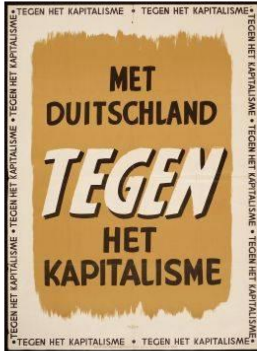
El Partido Nazi Holandés era igualmente explícito: "Con Alemania Contra el Capitalismo"